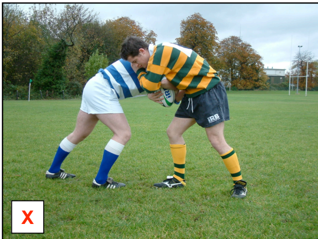
Le maul n'est pas formé