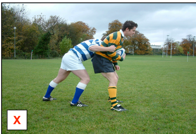
Le maul n'est pas formé