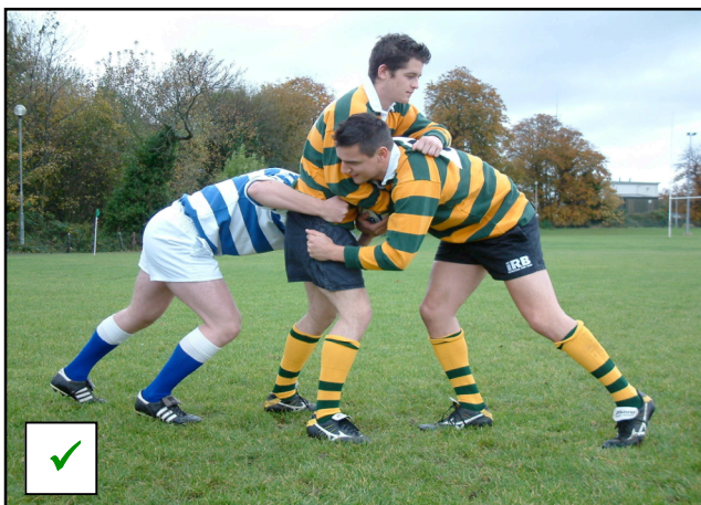
Le maul est formé

Un maul ne peut avoir lieu que dans le champ de jeu.